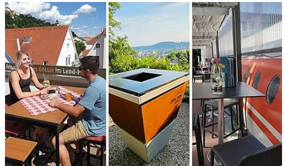
Neue Genüsse in Graz in luftiger Höhe

Stimmt schon, selbst im x-ten Lockdown stand die Grazer Gastroszene nie still : Zwischen Puntigam und Andritz, zwischen Ries und Eggenberg brachten Wirte Liefer- und Abholservices ins Rollen. Jetzt aber, da aktuelle Lockerungen wieder vieles erlauben, tischen sie erst recht auf: Eben erst wurde ja das neue Restaurant "Klyo" am Schloßbergplatz eröffnet.