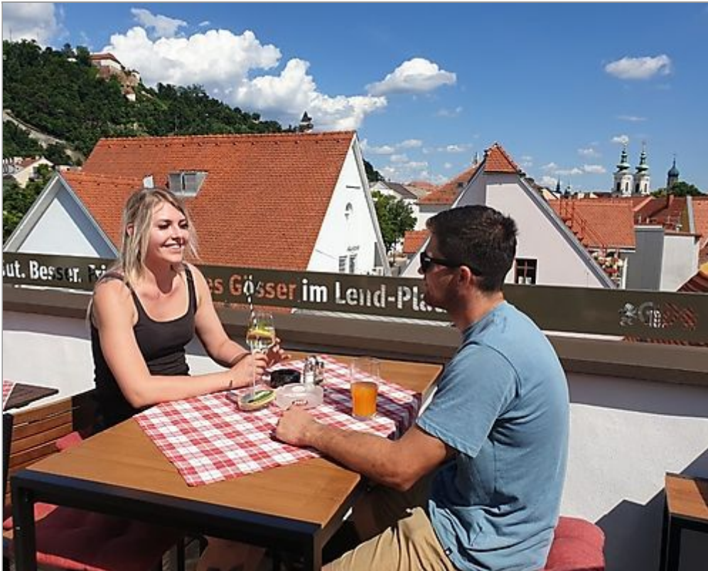
Lendplatzl: die neue Dachterrasse mit Blick über Graz als Beilage

Schon geht es Schlag auf Schlag weiter: Die Familie Klug etwa hat "schon so eine Million Euro" in ihr Gasthaus Lendplatzl investiert. Was während der Coronazeit geschah, können Gäste seit Kurzem bestaunen - und nutzen: Zum einen schmaust man im Lendplatzl ab sofort auch auf einer nagelneuen Dachterrasse .